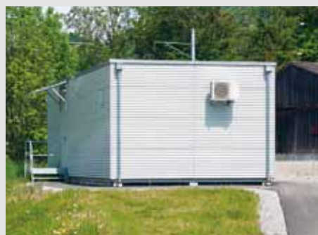
Grossraumkabine mit Flachdach und Alufassade.