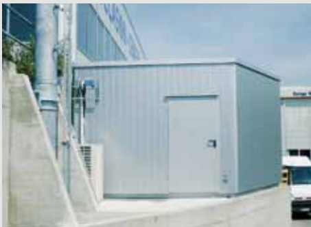
Technikkabine mit Flachdach und Alufassade. Lieferbar in verschiedenen Farben (nach Kundenwunsch).

Ob gross oder klein, ob Stadt oder Land – unsere Technikkabinen sind ideal für den vielseitigen Einsatz