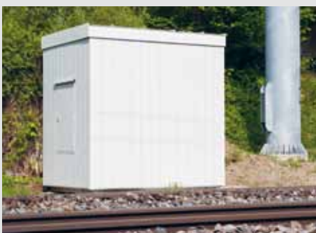
Kabine zum Schutz für mobile Funknetze und Kontrollsysteme.