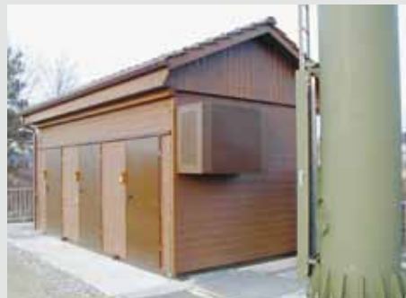
3er-Technikkabine für unterschiedliche, unabhängige Nutzer am gleichen Standort. Mit Giebeldach und Châlet-schalung.